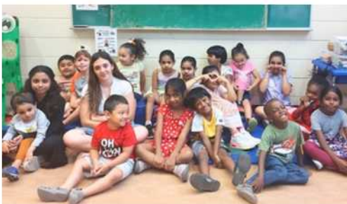
Jardin d'enfants 2026