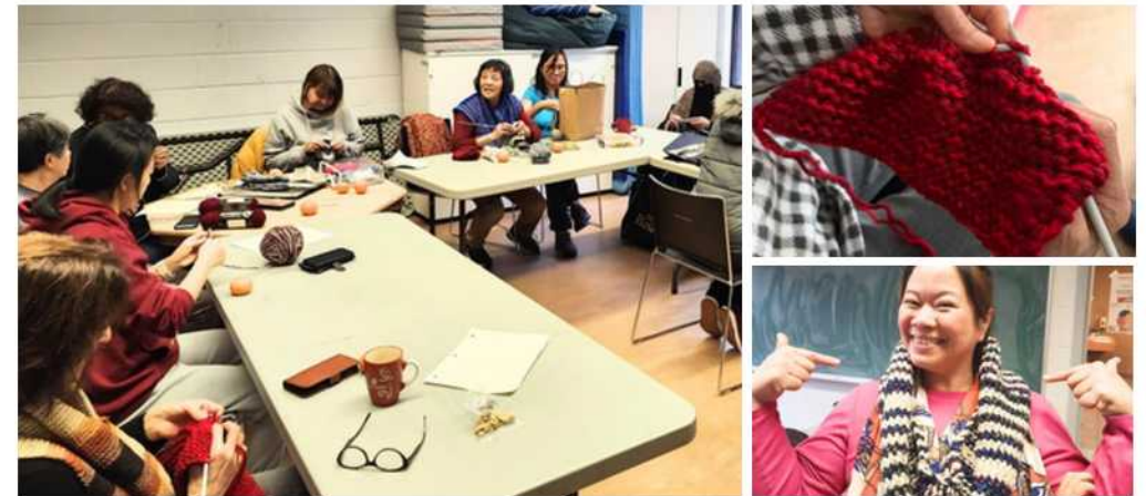
Ateliers de tricot