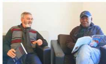
Club de lecture