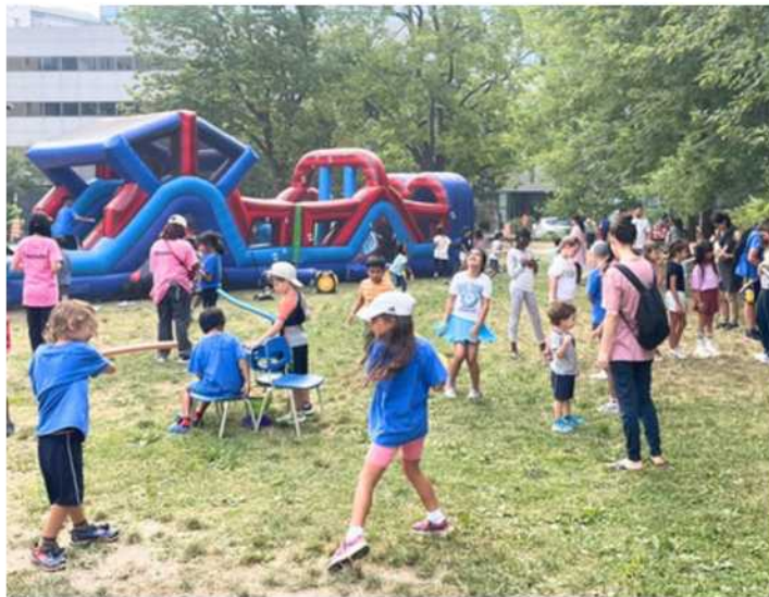
Camp de jour

L'été 2025 a marqué une croissance importante du camp de jour , qui a accueilli beaucoup plus d'enfants que l'année précédente. Les jeunes ont participé à de nombreuses sorties et activités, dont La Ronde et le Super Aqua Club, tout en profitant d'un environnement stimulant et sécuritaire.