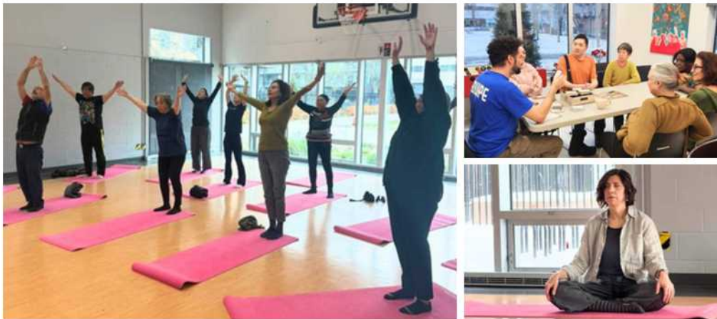
Cours de tai-chi