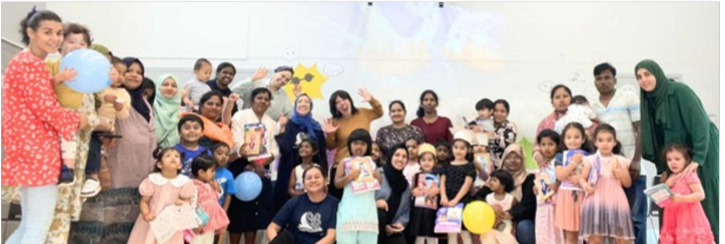
Jardin d'enfants 2026

La Petite école d'été a accueilli 23 enfants sur 28 journées d'activités éducatives. Cette initiative consolide les apprentissages des enfants avant leur entrée scolaire en favorisant le développement de leurs habiletés cognitives, sociales, langagières et physiques. Très appréciée des familles, elle permet de rassurer les parents face à la transition vers l'école. Plusieurs enfants y participent d'une année à l'autre, témoignant ainsi de son impact durable auprès des familles du secteur Le Triangle.