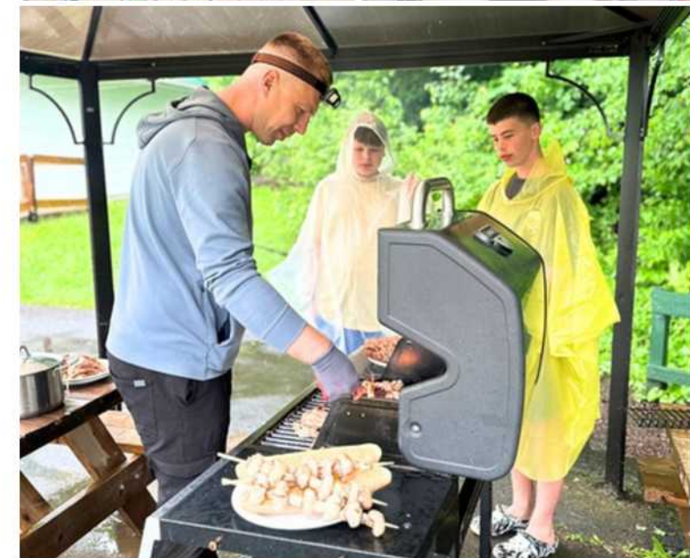
Camp Étincelle BBQ