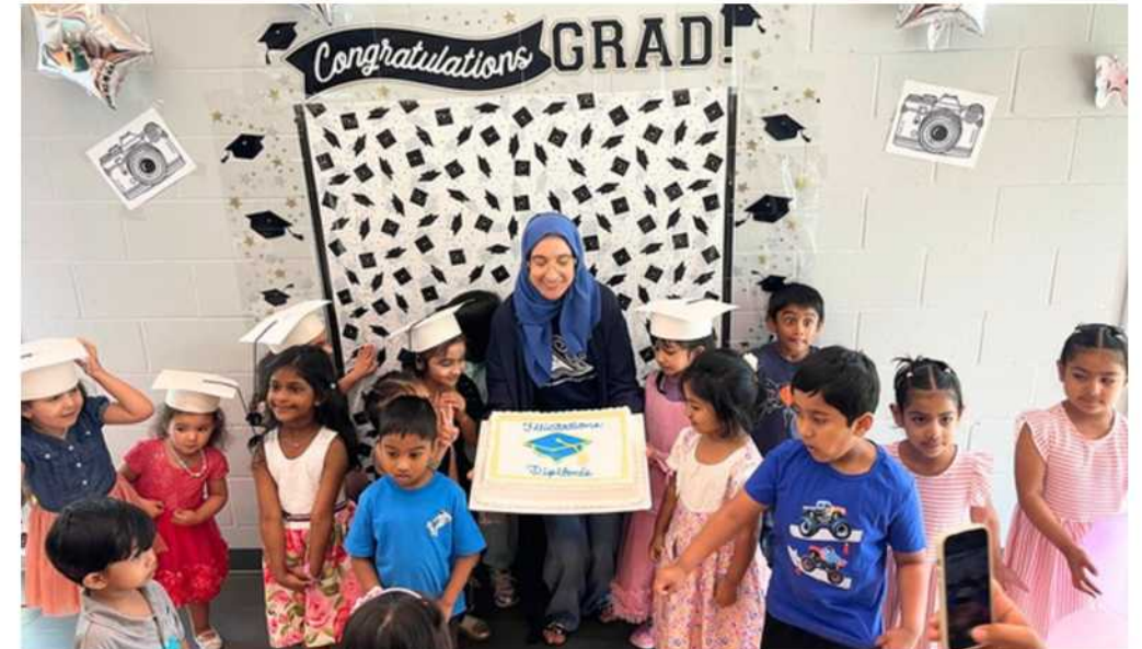
Jardin d'enfants 2026