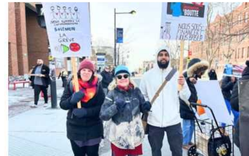
Mobilisation communautaire à Côte-des-Neiges