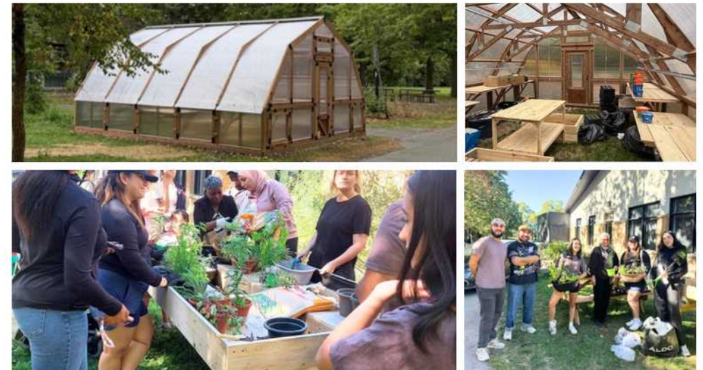
Jardin du CCMS

Cette année, l'installation d'une serre ainsi que l'avancement du projet de ruelle verte ont marqué une étape importante dans le développement du secteur. Ces initiatives contribuent à verdir le milieu de vie tout en renforçant la résilience alimentaire et environnementale de la communauté.