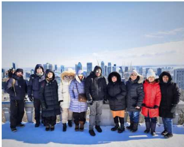
Marche hivernale Mont-Royal

Dès la première marche, l'enthousiasme et la joie du groupe ont été très présents. Pour assurer le confort et la sécurité de tous, au besoin, du matériel adapté (crampons et bâtons) est mis à disposition gratuitement. Les marches contribuent à la santé physique et au bien-être global des aîné.es tout en renforçant le lien social et le sentiment d'appartenance. Elles leur redonnent le plaisir d'être actif.ves dans leur communauté.