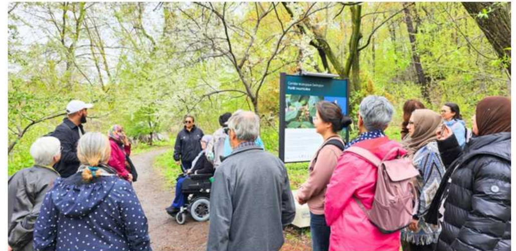
Marche au corridor écologique Darlington