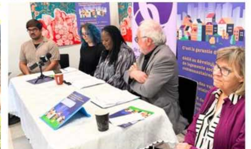
Conférence de presse sur le développement du site de l'ancien hippodrome