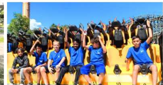
Camp de jour